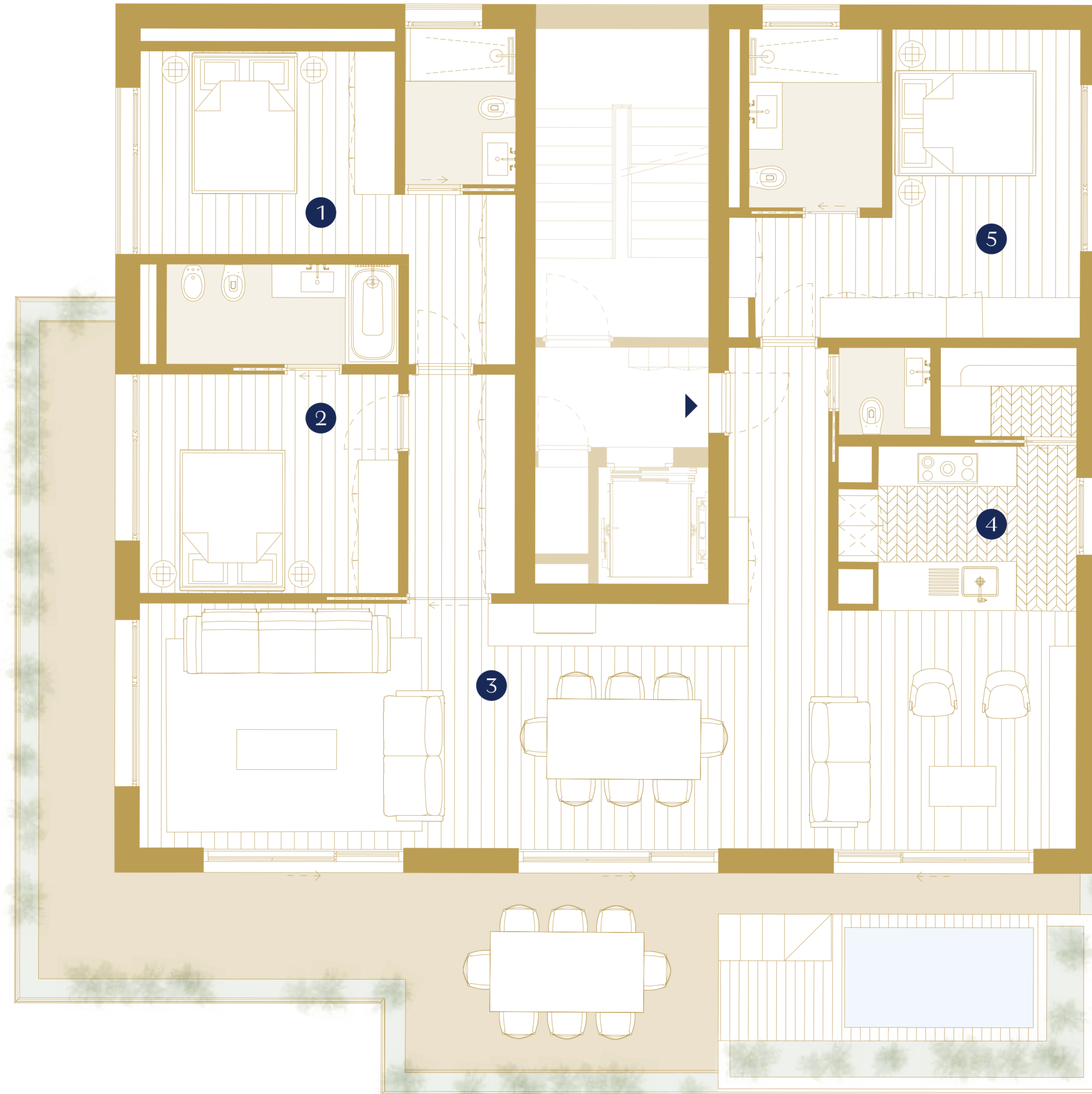
Third Floor | Piso 3