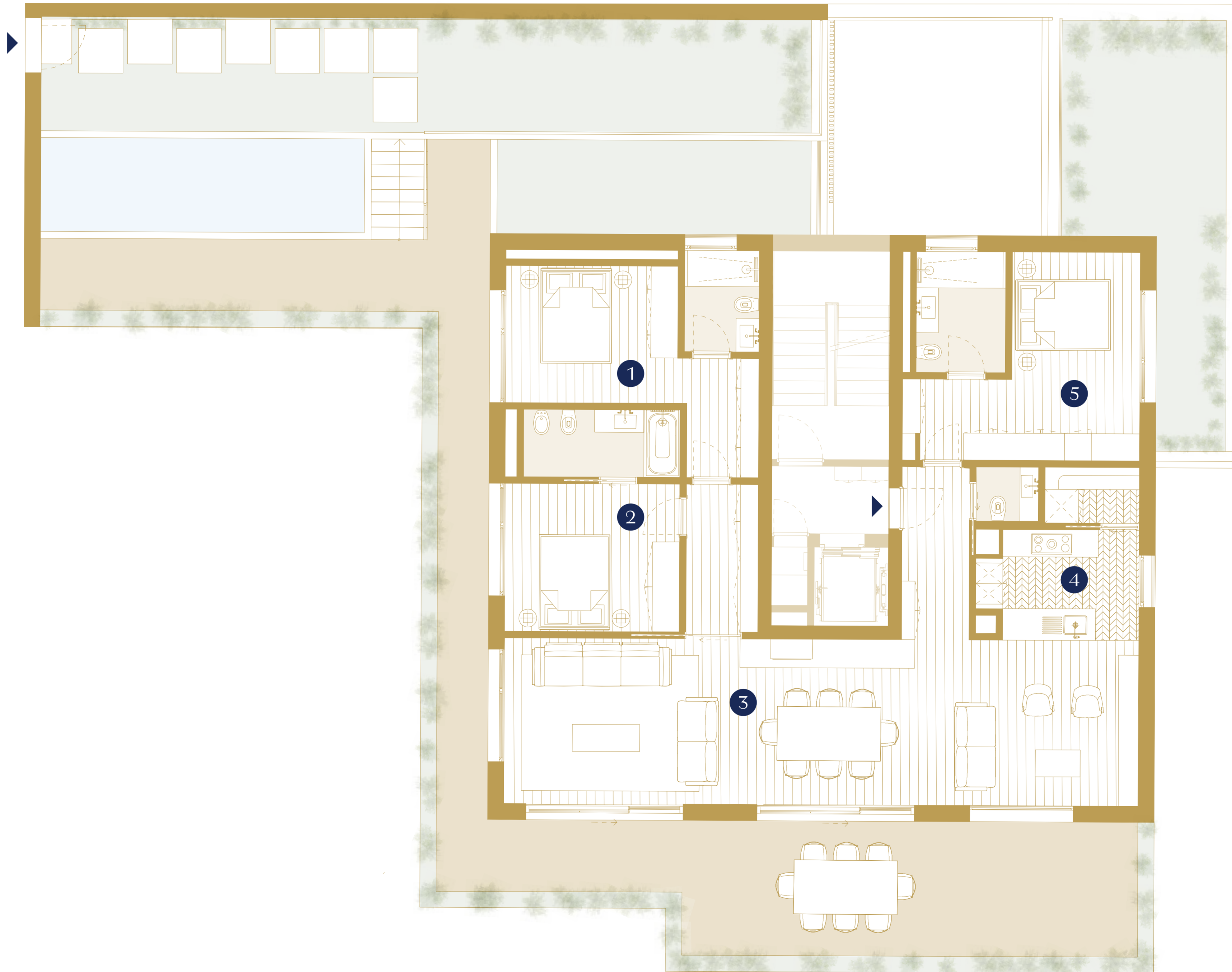
Second Floor | Piso 2