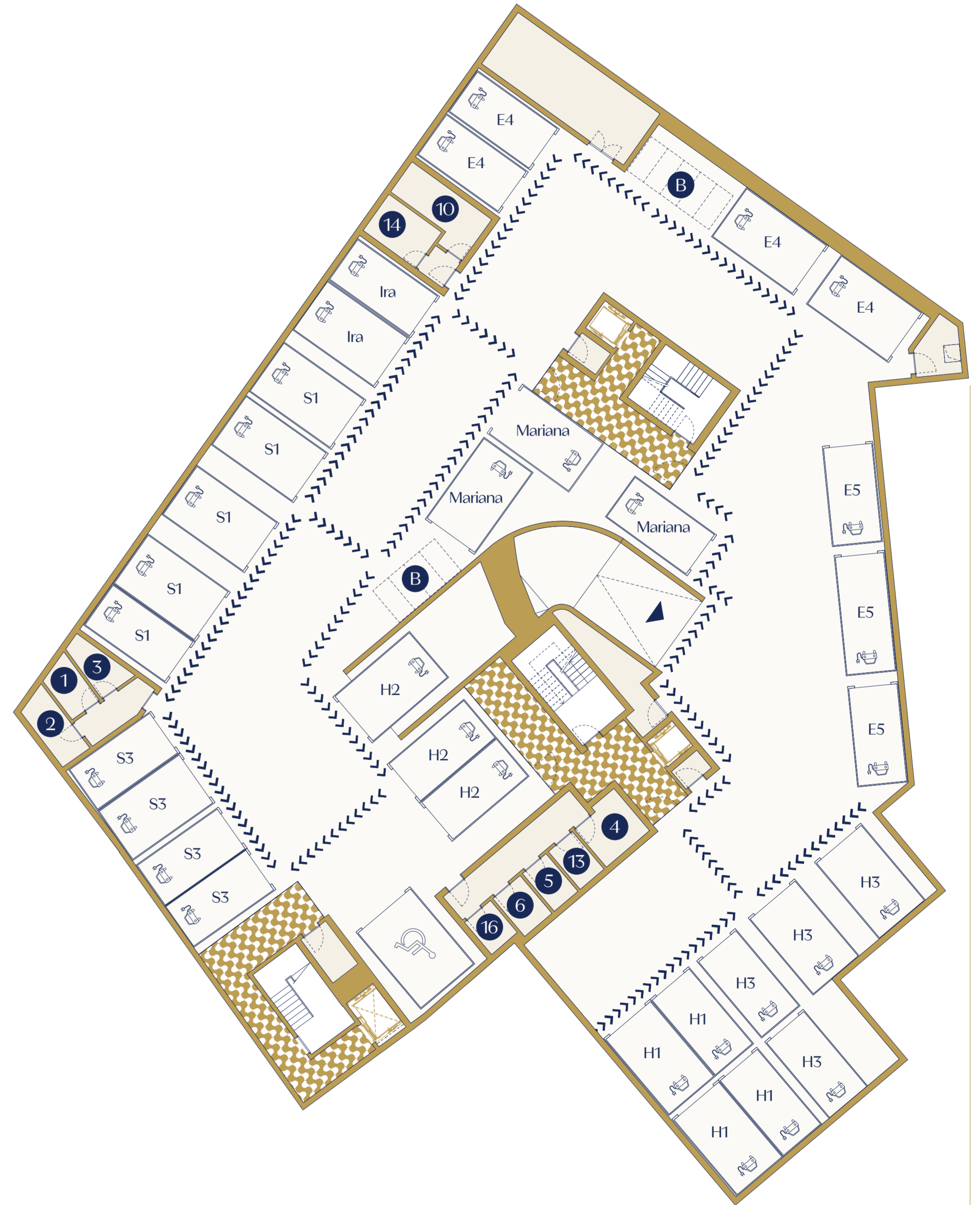
Floor -2 | Piso -2