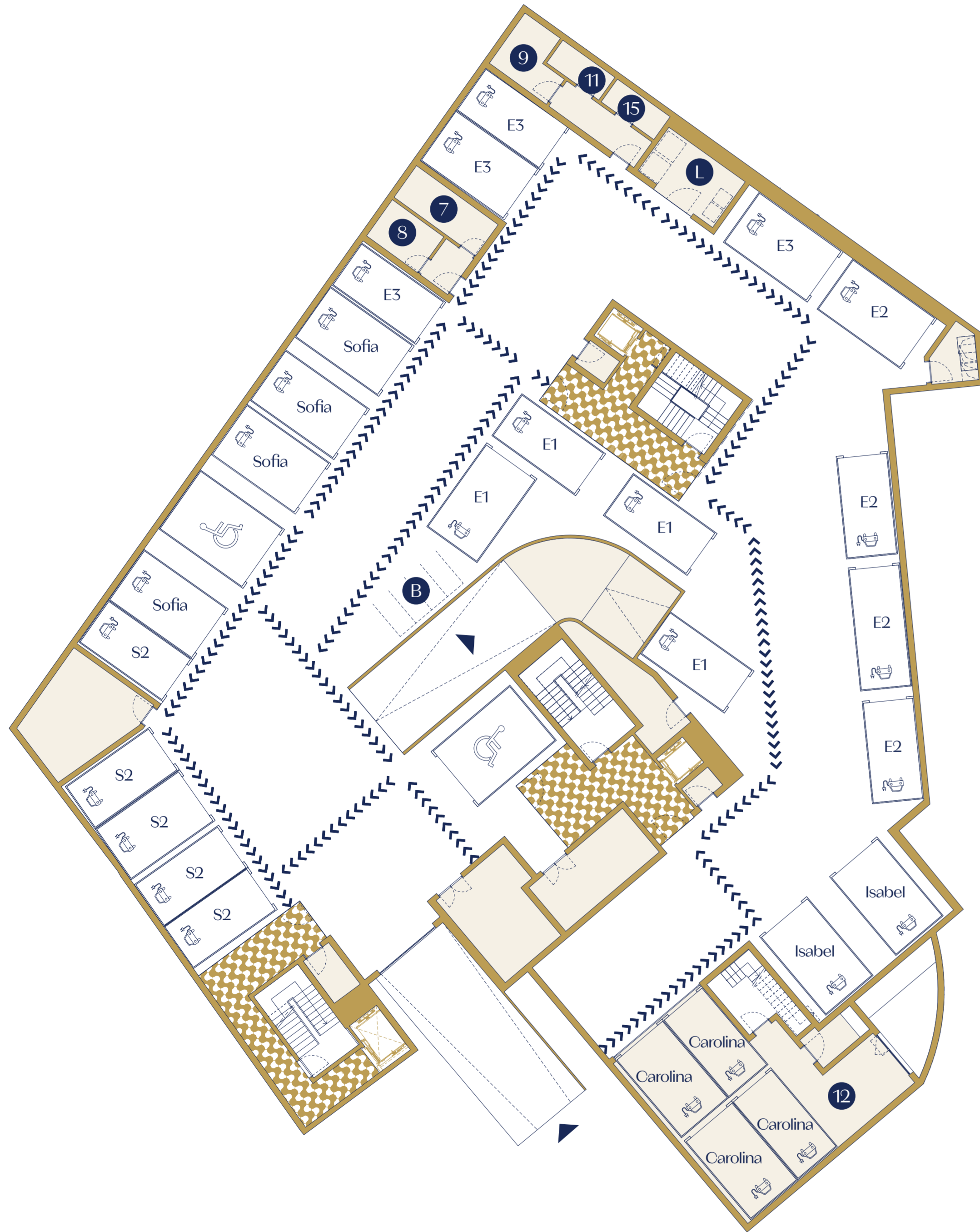
Floor -1 | Piso -1